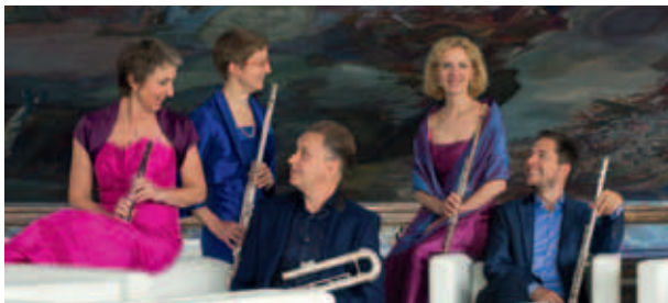
Quintessenz