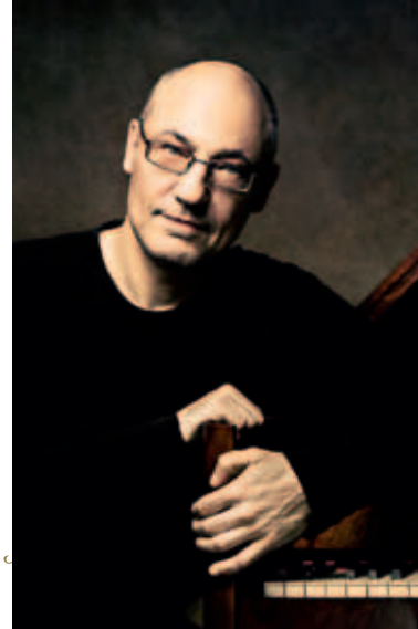
Andreas Staier

Es zieht sich eine ununterbrochene Spur der Empfindsamkeit von C. Ph. E. Bach bis hin zu J. Brahms. Isabelle Faust und Andreas Staier nehmen diese Fährte auf; sie spannen einen gefühlvollen romantischen Programmbogen über mehr als ein Jahrhundert deutscher Kammermusik. Ihr unmittelbarer Zugang zur Musik lässt Isabelle Faust zum Wesentlichen vordringen. Das Publikum spürt ihre natürliche