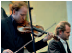
Daniel Hope, Sebastian Knauer