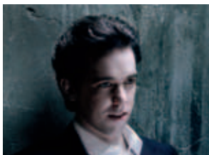
Ingolf Wunder