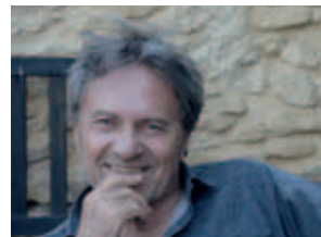
Wolfram Berger

Lesung mit Musik Landesmusikschule Gmunden WOLFRAM BERGER, FRIEDRICH KLEINHAPL & ANDREAS WOYKE Kartenpreis: € 27,-