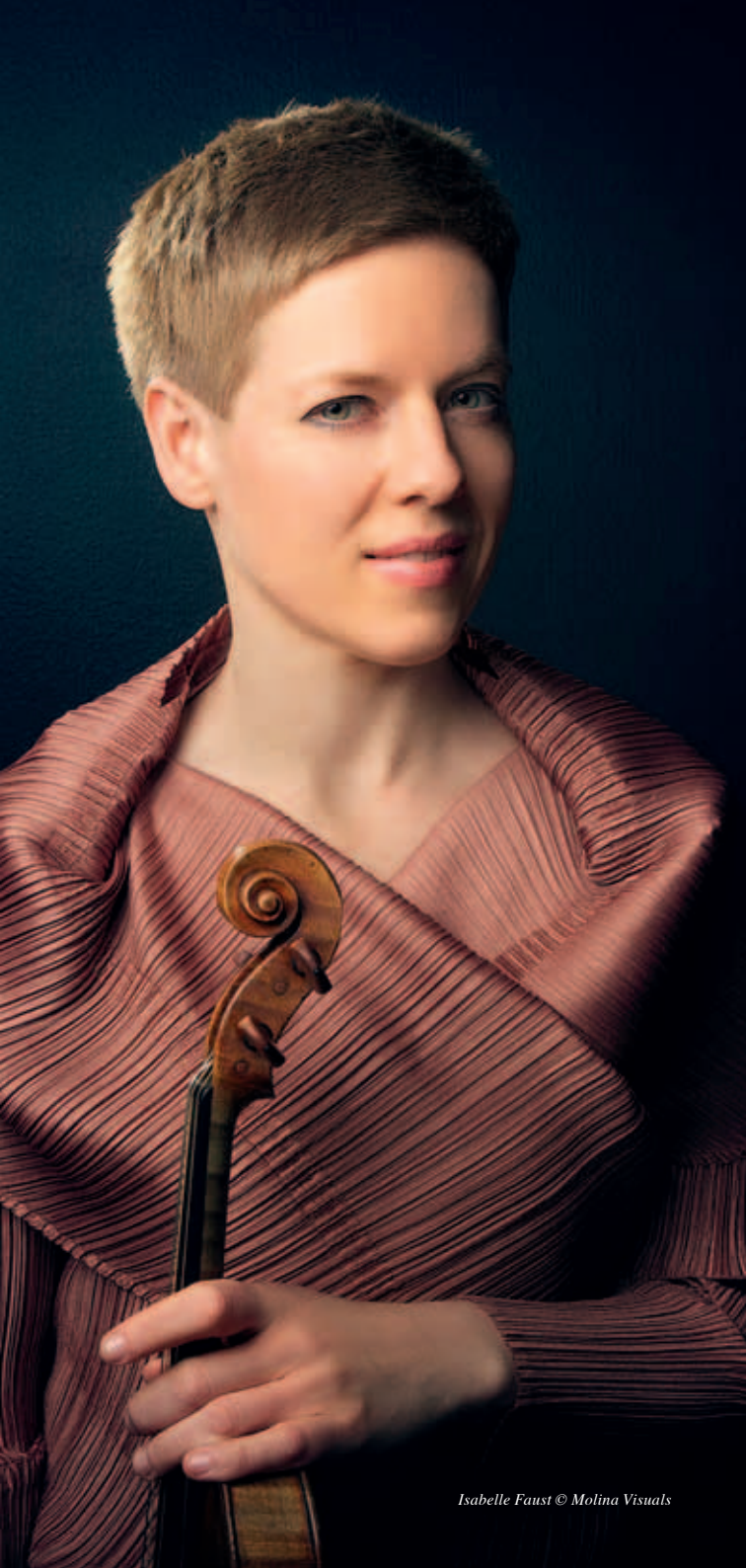
Isabelle Faust