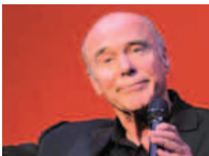
Michael Heltau

Mittwoch, 2.8., 19:30 Konzert Stadttheater Gmunden DANIEL HOPE & SEBASTIAN KNAUER Kartenpreis: € 39,-