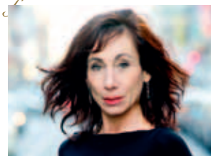
Andrea Eckert

Konzert mit Lesung Landesmusikschule Gmunden ANDREA ECKERT & MERLIN ENSEMBLE WIEN Kartenpreis: € 27,-