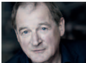
Burghart Klaußner

Sichern Sie sich Ihre Karten für die Veranstaltungen des kommenden Sommers! Bestellungen sind ab sofort möglich.