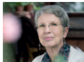
Barbara Frischmuth

Literaturschwerpunkt EIN FEST FÜR BARBARA FRISCHMUTH Tageskarte: € 27,-